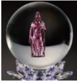
K18パープルゴールド 聖観音像